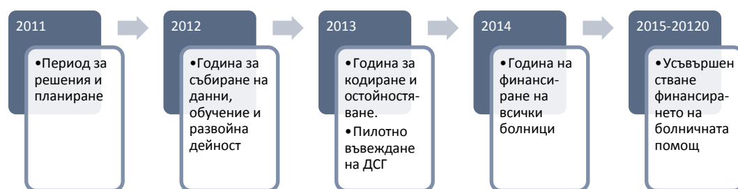
Фиг. 1: Пътна карта на въвеждане на нов модел за заплащане на болничната помощ

Общата стойност на проектите за държавни лечебни заведения възлиза на 147.1 млн. лв., а предвидената стойност за общински лечебни заведения е 139.4 млн. лв. Очакваният ефект от обновяването на лечебните заведения ще засегне пряко над 4.4 млн. души.